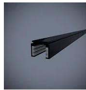
519 Binario elettrificato