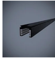
521 Binario elettrificato