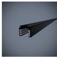
592J Binario elettrificato